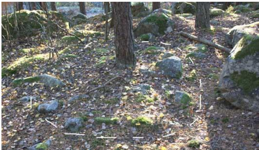
1. Rund stensättning, ca 3 meter i diameter, med ett träd växande i stensättningen