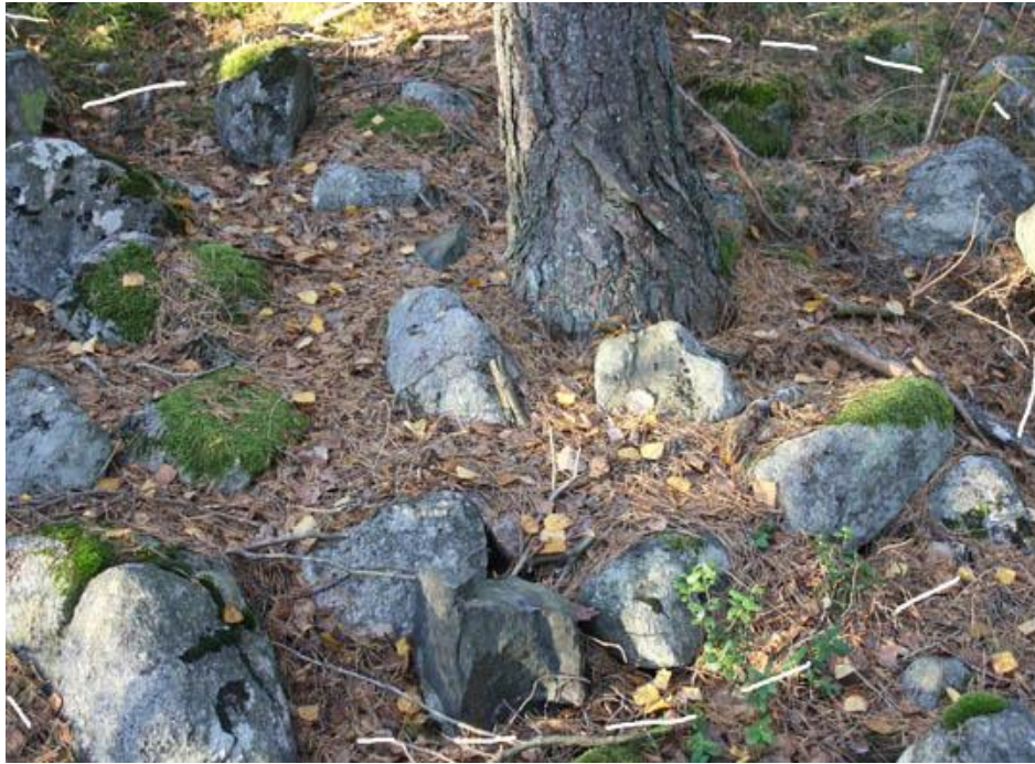
11. Rund stensättning, ca 3 meter i diameter, med ett träd växande i stensättningen