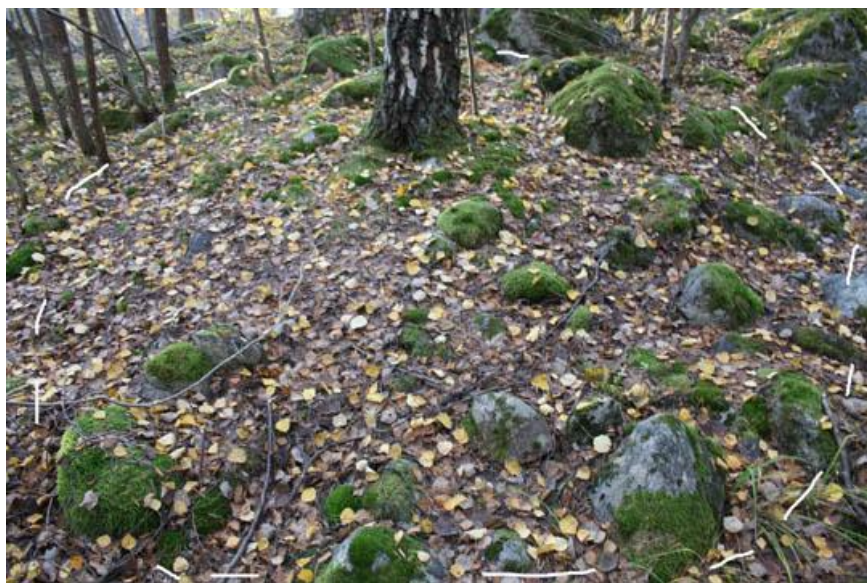
6. Röseliknade rundstensättning, ca 5-6 meter i diameter, med ett träd växande i stensättningen