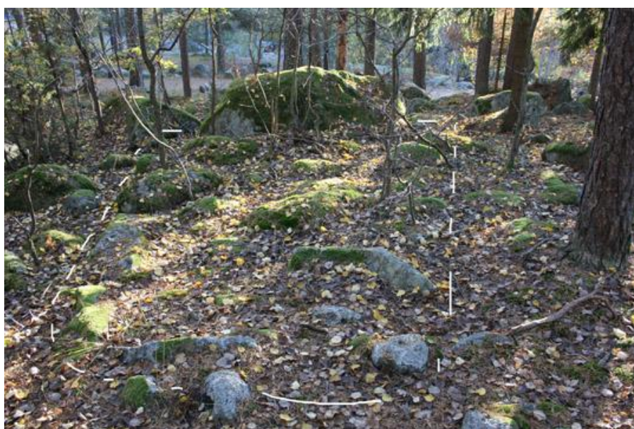
2. Fyrsidig stensättning mot stenblock