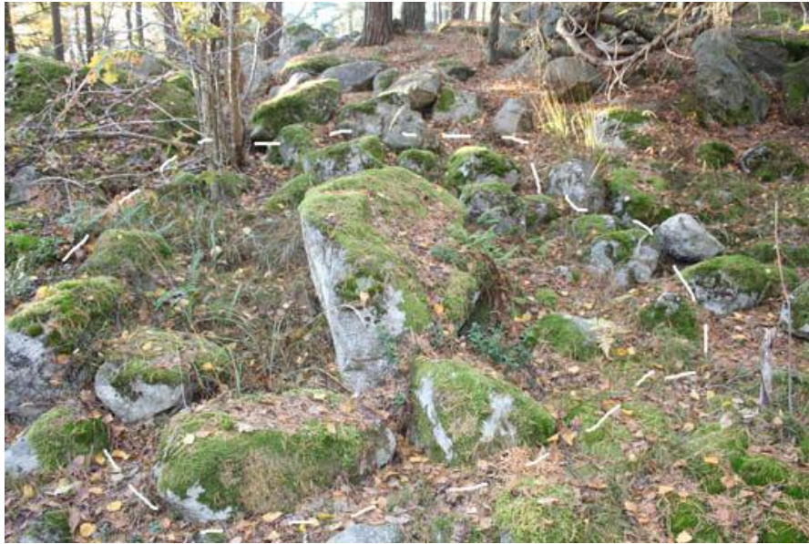
8. Blockstensgrav; stor sten omgiven av mindre stenar