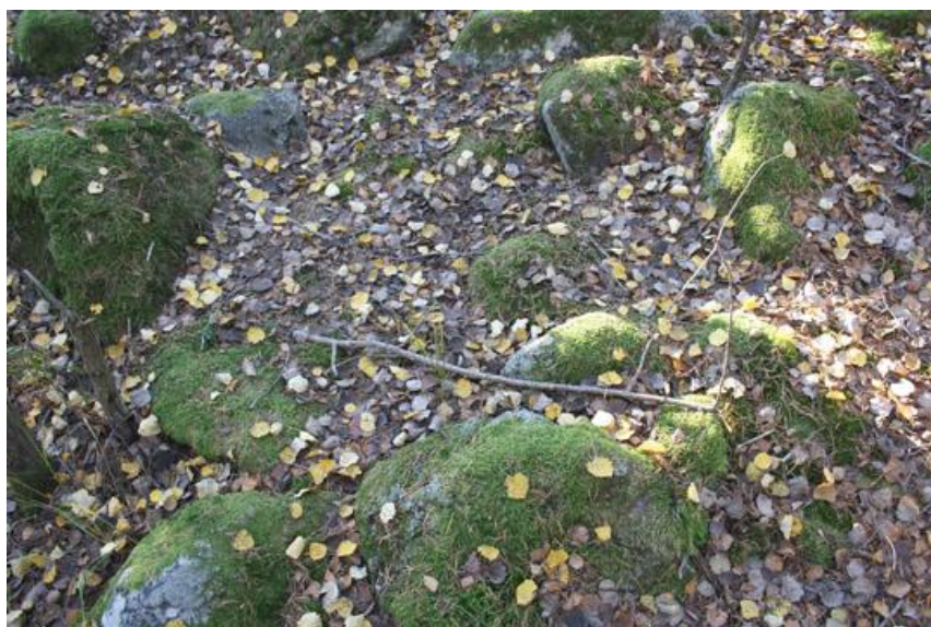
3. Rund stensättning