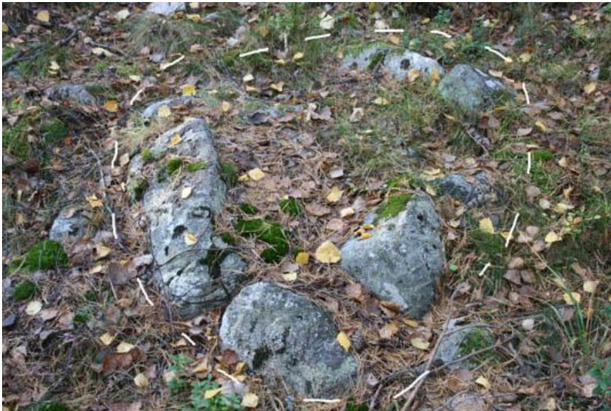
9. Rund stensättning