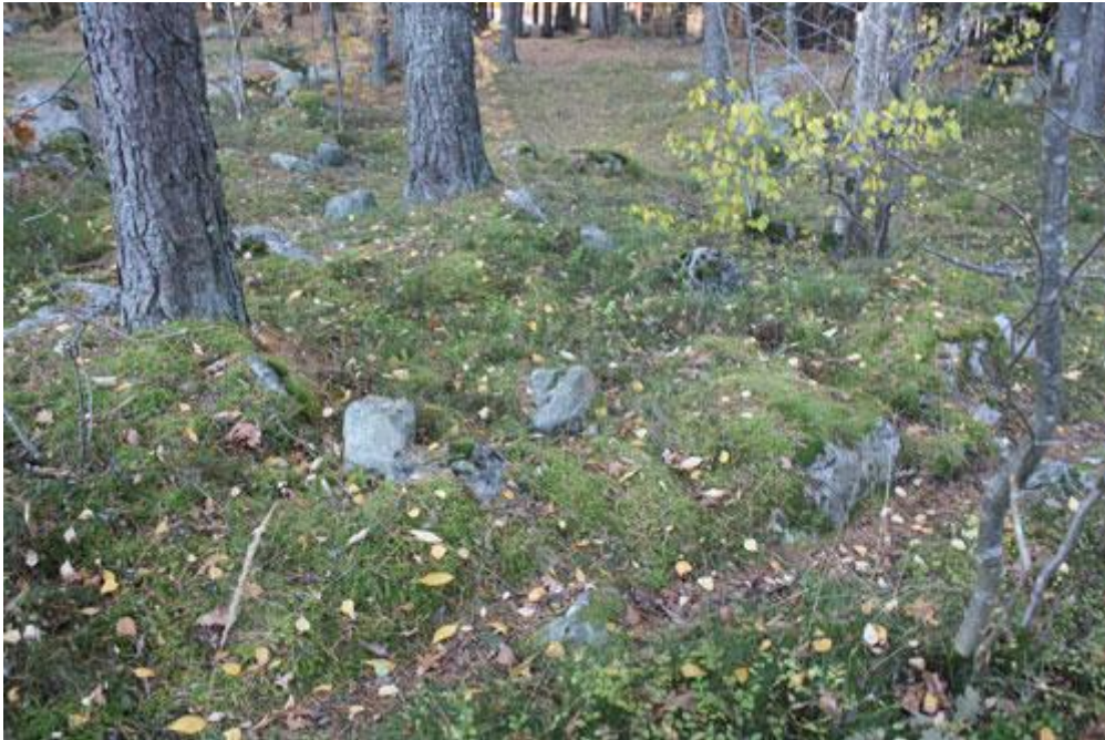
Fyrkantig stensättning vid hörnet Råbykorset 52