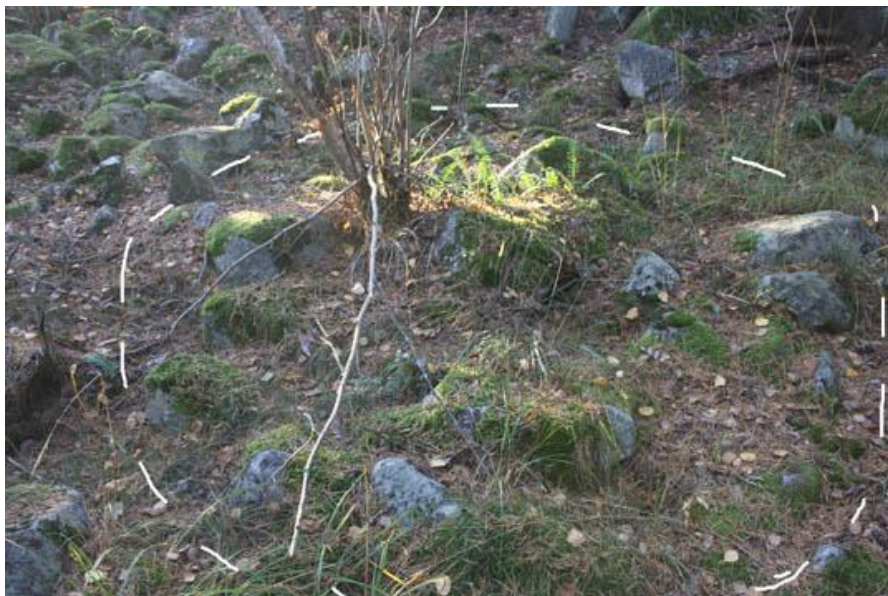
10. Rund stensättning, med en buske växande i stensättningen