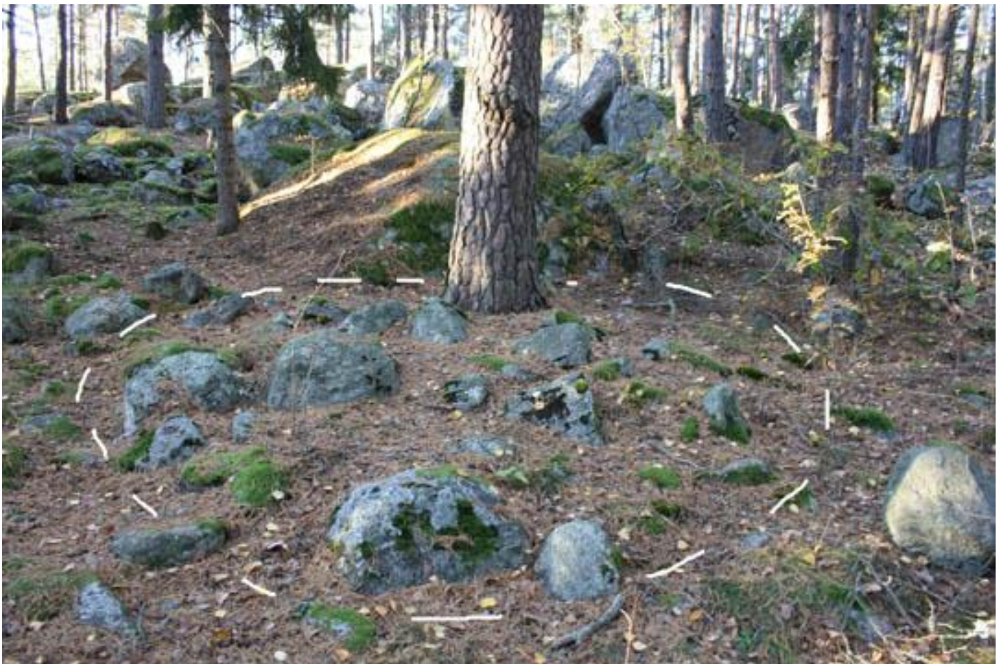
12. Rund stensättning