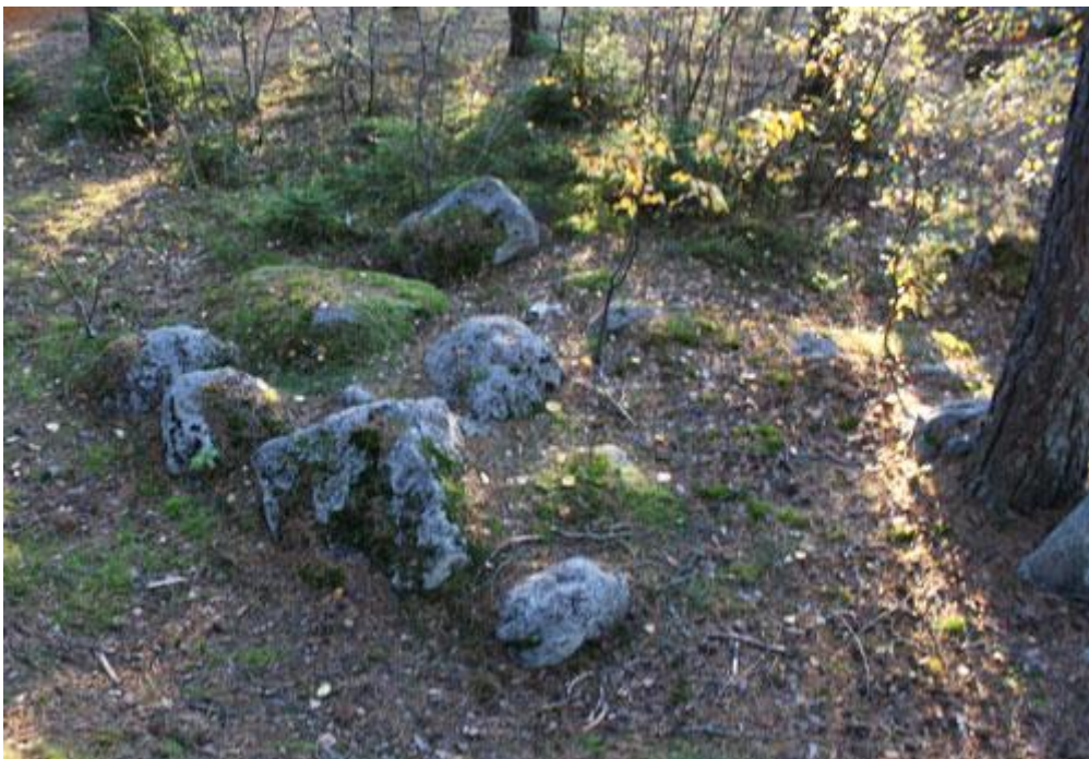
Fyrkantig stensättning vid utsiktsplatsen Råby klacken